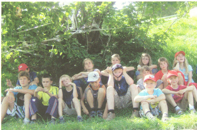
Die Valzeiner Schüler vor ihrem Kunstwerk.